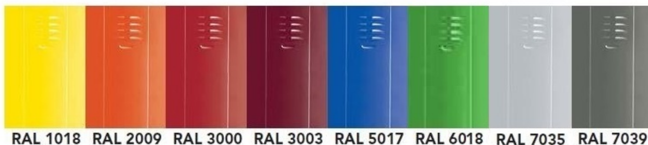
RAL 1018 RAL 2009 RAL 3000 RAL 3003 RAL 5017 RAL 6018 RAL 7035 RAL 7039