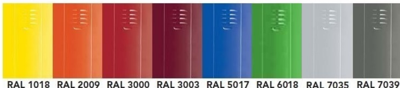
RAL 1018 RAL 2009 RAL 3000 RAL 3003 RAL 5017 RAL 6018 RAL 7035 RAL 7039