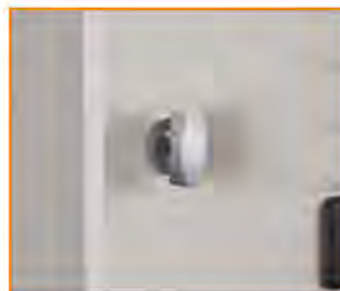
Maniglia in metallo lucchettabile a frizione con sistema anti effrazione Freewheeling padlock handle Fermeture à cadenas Sicherheitsdrehriegel für Vorhängeschloss