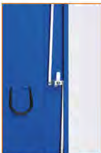
Serratura a 3 punti di chiusura 3 Point locking system Fermeture à 3 points Schloss mit 3 Schließpunkte