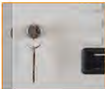
Serratura a cilindro (passepartout disponibile) Key lock (master key available) Serrure à clé (passepartout disponible) Zylinderschloss (Passepartout verfügbar)