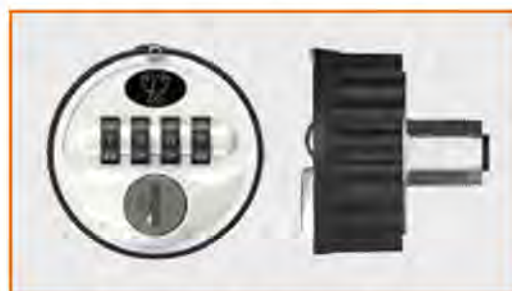
Serratura a combinazione meccanica (passepartout disponibile) Combination lock (master key available) Serrure à combinaison mécanique (passepartout disponible) Mechanisches Zahlenschloss (Passepartout verfügbar)