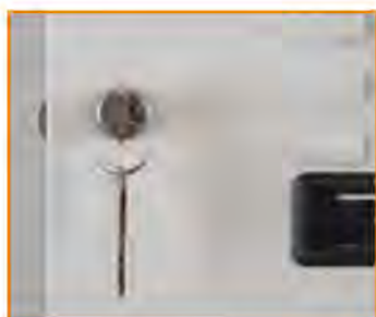
Serratura a cilindro (passepartout disponibile) Key lock (master key available) Serrure à clé (passepartout disponible) Zylinderschloss (Passepartout verfügbar)