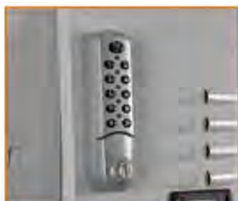
Serratura con apertura a codice elettronico Electronic lock (master key available) Serrure à code électronique Elektronisches Zahlenschloss