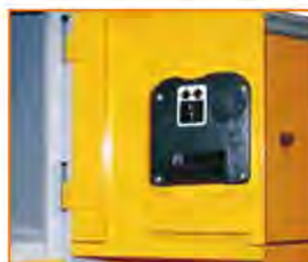
Serratura a moneta (con funzionamento a cauzione) Coin lock (public use) Serrure à monnayeur (à caution) Münzpfandschloss (Kautions Arbeitssystem)