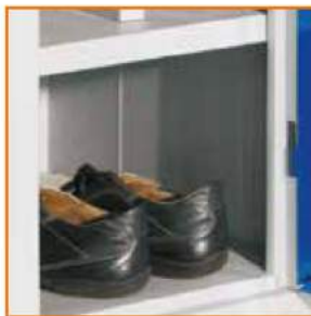
Piano porta scarpe vano unico Shelf for shoes "I" shape Étangère pour Chaussures Breites Schuhfach

ACCESSORI Optionals - Accessoires - Zubehöriteile