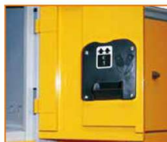
Serratura a moneta (con funzionamento a cauzione) Coin lock (public use) Serrure à monnayeur (à caution) Münzpfandschloss (Kautions-Arbeitssystem)