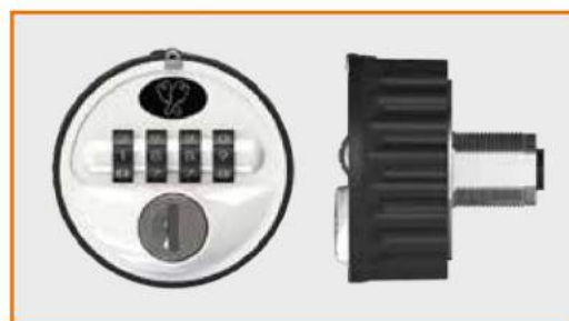
Serratura a combinazione meccanica (passepartout disponibile) Combination lock (master key available) Serrure à combinaison mécanique (passepartout disponible) Mechanisches Zahlenschloss (Passepartout verfügbar)