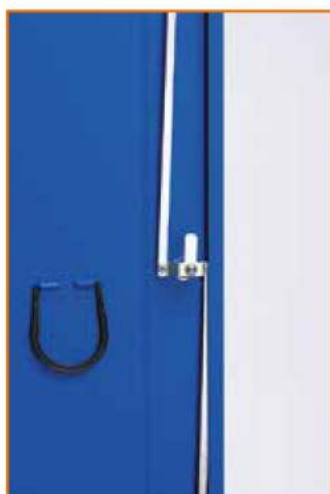
Serratura a 3 punti di chiusura 3 Point locking system Fermeture à 3 points Schloss mit 3 Schließpunkte