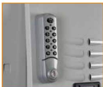
Serratura con apertura a codice elettronico Electronic lock (master key available) Serrure à code électronique Elektronisches Zahlenschloss