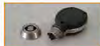
Serratura con apertura chiave elettronica Transponder key Serrure électronique Schloss mit Öffnung durch elektronischen Schlüssel