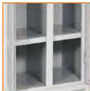
Piano porta scarpe S/P Shelf for shoes Tablette pour chaussures Schuhfach mit innerer Trennwand