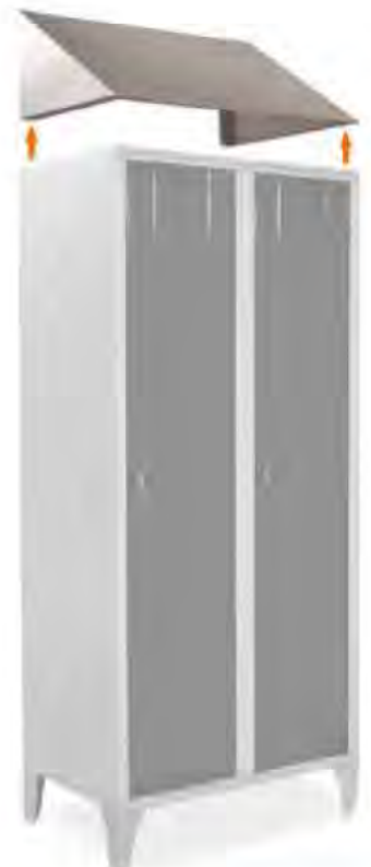
Tetto inclinato Sloping tops Coiffes inclinées Schrägdach