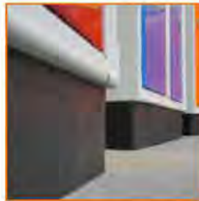
Zoccolo di base in plastica Plastic plinth Socle en polypropylène Sockel aus Polypropylen