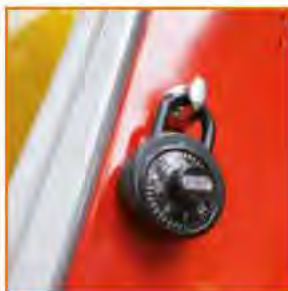
Lucchetto a combinazione Combination Padlock Cadenas à combinaison Zahlenschloss