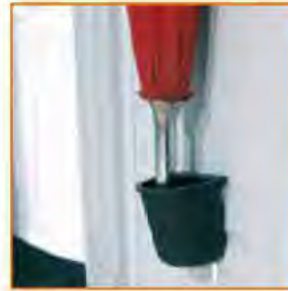
Porta ombrello con vaschetta raccogli gocce Umbrella holder with drip-tray Porte-parapluie avec petit égouttoir Regenschirmhalter mit Tropfschale