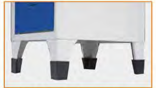
Copri piedi in plastica anti corrosione Plastic shells for feet Coquille en plastique pour pieds Kunststoffhalter für FüÙe als Korrosionsschutz