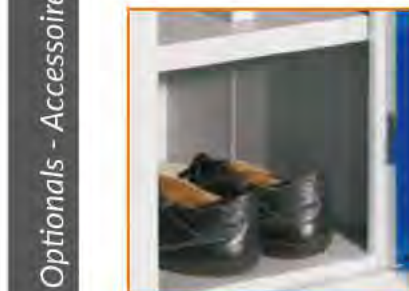
Piano porta scarpe vano unico Shelf for shoes "I" shape Étangère pour Chaussures Breites Schuhfach