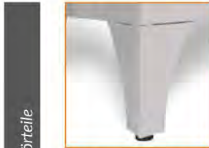
Piedi regolabili con puntali in plastica Adjustable feet Pieds réglables avec coquille en plastique Höhenverstellbare FüÙe mit Gummienden