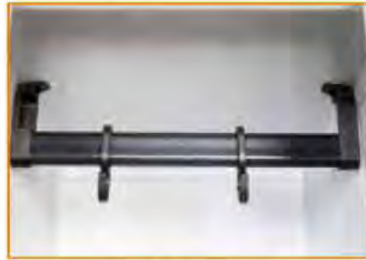
Tubo ovale porta grucce in PVC completo di ganci scorrevoli Plastic coat hanger rod and sliding hooks Tringle porte-cintres en PVC avec crochets coulissants Oval Rohr aus PVC mit beweglichen Kleiderhaken