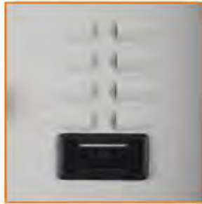
Porta cartellino in materiale plastico Plastic card holder on door Porte-étiquette en plastique Namensschildhalter aus Kunststoff