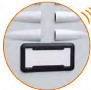
Porta cartellino in plastica Plastic card holder Porte-étiquette en plastique Namensschildhalter aus Kunststoff