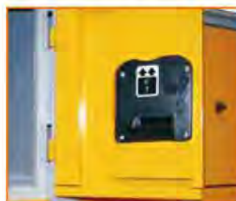
Serratura a moneta (con funzionamento a cauzione) Coin lock (public use) Serrure à monnayeur (à caution) Münzpfandschloss (Kautions Arbeitssystem)