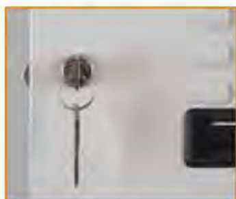
Serratura a cilindro (passepartout disponibile) Key lock (master key available) Serrure à clé (passepartout disponible) Zylinderschloss (Passepartout verfügbar)