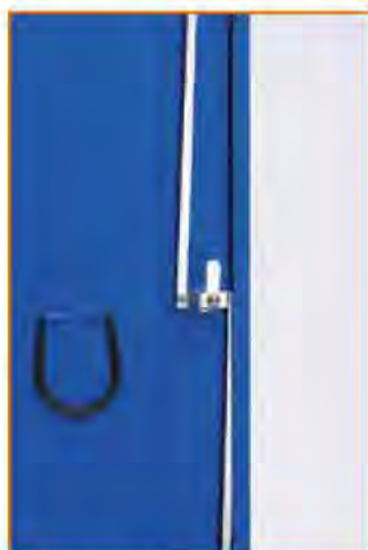
Serratura a 3 punti di chiusura 3 Point locking system Fermeture à 3 points Schloss mit 3 Schließpunkte