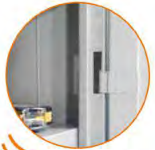
Cerniere interne anti effrazione Internal hinges Charnières spéciales anti-effraction Einbruchsichere innenliegende Scharnieren