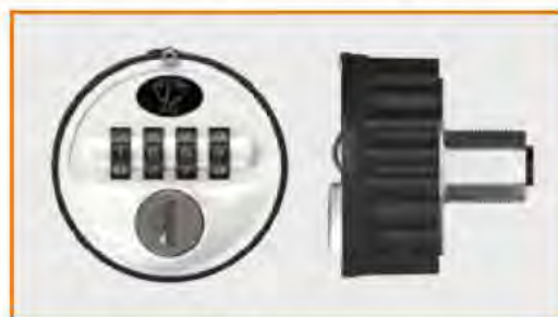
Serratura a combinazione meccanica (passepartout disponibile) Combination lock (master key available) Serrure à combinaison mécanique (passepartout disponible) Mechanisches Zahlenschloss (Passepartout verfügbar)