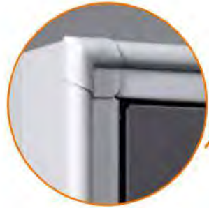
Bordo arrotondato antiurto Rounded edge Bord arrondi antichoc Abgerundete Vorderkante