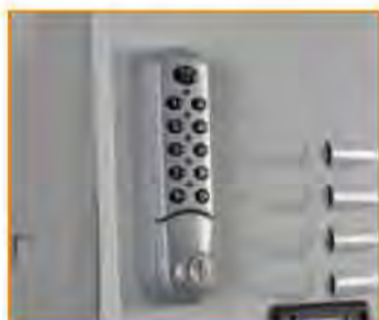
Serratura con apertura a codice elettronico Electronic lock (master key available) Serrure à code électronique Elektronisches Zahlenschloss