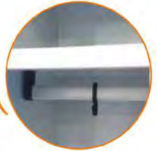
Tubo ovale appendiabiti in PVC Plastic coat hanger rod with sliding hooks Tringle porte-cintres en PVC Oval Rohr aus PVC mit Kleiderhaken