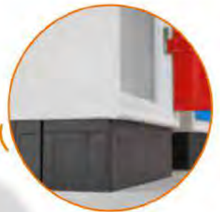
Zoccolo in polipropilene Plastic plinth Socle en polypropylène Sockel aus Polypropylen