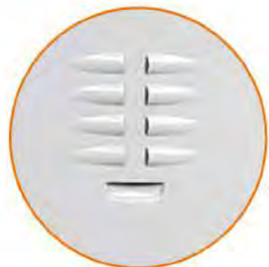
Feritoie d'aerazione Aeration slits Fentes d'aération Lüftungsschlitzen