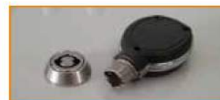
Serratura con apertura chiave elettronica Transponder key Serrure électronique Schloss mit Öffnung durch elektronischen Schlüssel