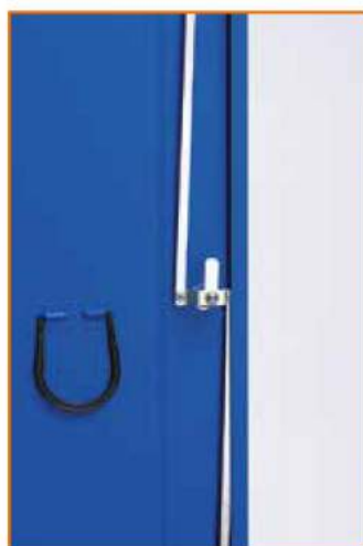
Serratura a 3 punti di chiusura 3 Point locking system Fermeture à 3 points Schloss mit 3 Schließpunkte