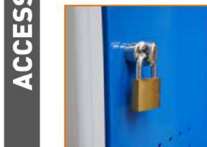
Lucchetto metallico Padlock Cadenas métallique Vorhängeschloss