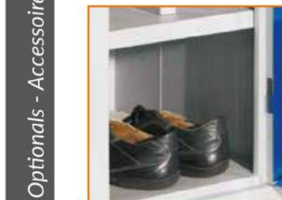
Piano porta scarpe vano unico Shelf for shoes "I" shape Étagère pour Chaussures Breites Schuhfach