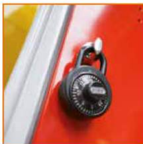
Lucchetto a combinazione Combination Padlock Cadenas à combinaison Zahlenschloss