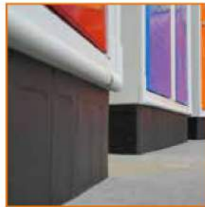
Zoccolo di base in plastica Plastic plinth Socle en polypropylène Sockel aus Polypropylen