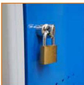
Lucchetto metallico Padlock Cadenas métallique Vorhängeschloss