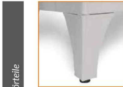
Piedi regolabili con puntali in plastica Adjustable feet Pieds réglables avec coquille en plastique Höhenverstellbare FüÙe mit Gummienden