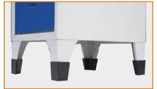
Copri piedi in plastica anti corrosione Plastic shells for feet Coquille en plastique pour pieds Kunststoffhalter für FüÙe als Korrosionsschutz

Optionalds - Accessoires - Zubehöriteile