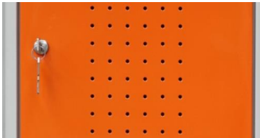
Ante provviste di fori di aerazione

Vernici: acriliche con elevata resistenza alla corrosione secondo le norme A.S.T.M.B. 117.64 e succ.var.