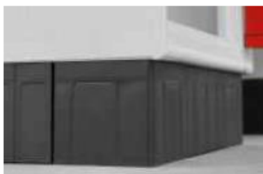
Zoccolo in polipropilene PP