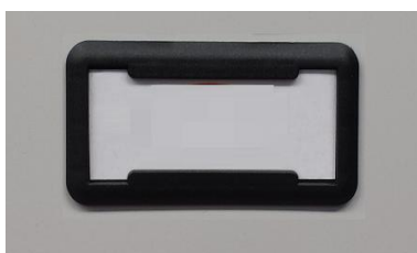
Porta cartellino in materiale plastico