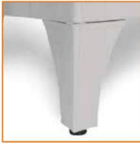
Piedi regolabili con puntali in plastica Adjustable feet Pieds réglables avec coquille en plastique Höhenverstellbare Füße mit Gummienden