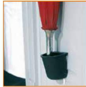
Porta ombrello con vaschetta raccogli gocce Umbrella holder with drip-tray Porte-parapluie avec petit égouttoir Regenschirmhalter mit Tropfschale