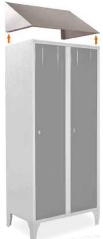
Tetto inclinato Sloping tops Coiffes inclinées Schrägdach