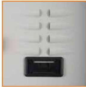
Porta cartellino in materiale plastico Plastic card holder on door Porte-étiquette en plastique Namensschildhalter aus Kunststoff