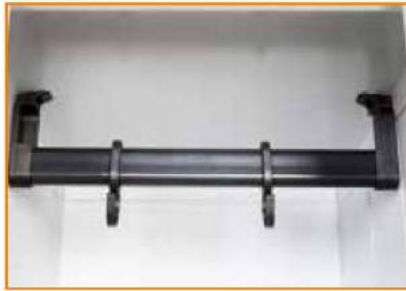
Tubo ovale porta grucce in PVC completo di ganci scorrevoli Plastic coat hanger rod and sliding hooks Tringle porte-cintres en PVC avec crochets coulissants Oval Rohr aus PVC mit beweglichen Kleiderhaken