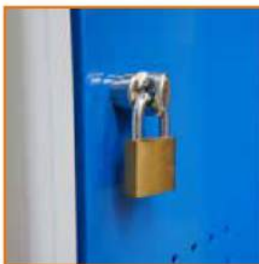
Lucchetto metallico Padlock Cadenas métallique Vorhängeschloss