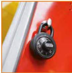
Lucchetto a combinazione Combination Padlock Cadenas à combinaison Zahlenschloss