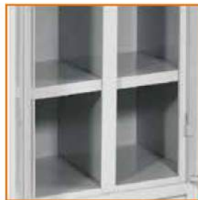
Piano porta scarpe S/P Shelf for shoes Tablette pour chaussures Schuhfach mit innerer Trennwand