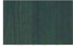
Wengè - Wengè Wengè - Wengè

Le vetrine della collezione Cast Premium sono note per l'eleganza delle forme e per il loro impatto espositivo. Nascono da un felice equilibrio tra il cristallo, il legno ed i profili in alluminio. La collezione Cast Premium è sinonimo di resistenza e di modularità in grado di proporre intelligenti soluzioni di arredamento di negozi, stands, esposizioni, abitazioni, ecc.