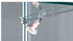
art. 3/A - 4/A - 5/A - 6/A Illuminazione alogena laterale per 3,4,5,6 ripiani Halogen side spotlights for 3,4,5,6 shelves