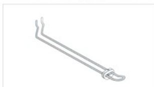
art. SB Serratura per gancio doppio per blister Lock four double hooks