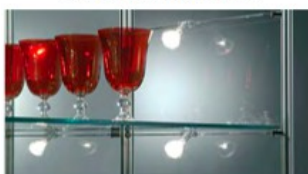
Esempio di ripiano regolabile in altezza Example of adjustable shelves