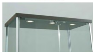
art. 53/AP - 70/AP - 73/AP - 93/AP Illuminazione alogena nella plafoniera Halogen top spotlights