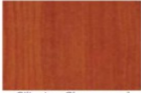
Ciliegio - Cherry-wood Cerisier - Kirsch