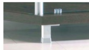
art. 4/PC Sostituzione ruote con piedini - 4/PC h. cm 6,5/7,5 Replacement of castors with feet -4PC h. cm 6,5/7,5