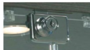
art. SA/2 Serratura antina doppia Lock for double doors