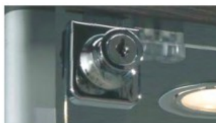
art. SA Serratura antina singola Lock for single door