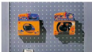
Esempio di schienale in metallo forato per blister Example of metal perforated back panel