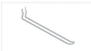
art. GL/15 - GL/20 - GL/30 Gancio per blister Hook for blister