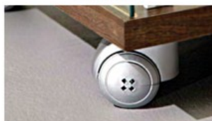
art. RU Ruota -portata 80 Kg. Castor -80 Kg. capacity